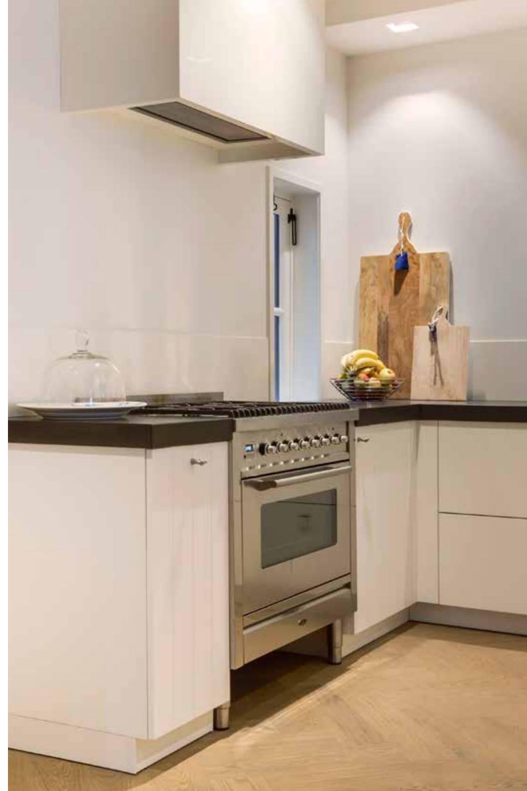
Omdat in de keuken geen daglicht komt, werd ze wit geschilderd (ralleur 9010). Op de vloer ligt een eikenhouten visgraatparket. Het aanrecht is van Belgische hardsteen. De stoere taatsdeuren zijn van staal en glas.